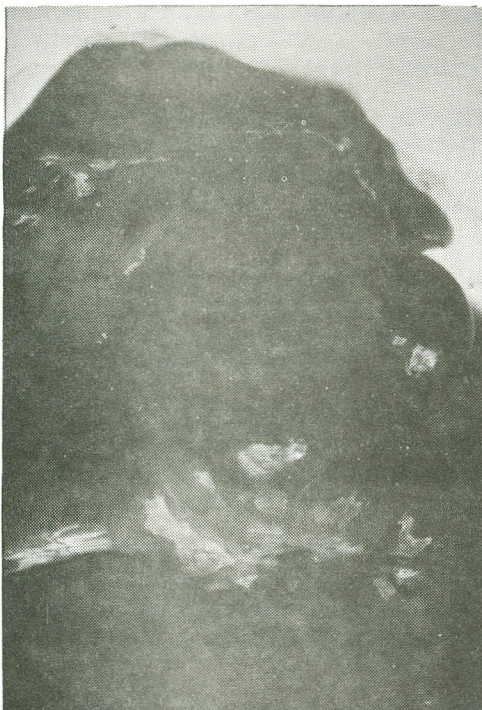
Figura 2. Exemplo de folículo anovulatório (ov. esquerdo) provocados por um tratamento de superovulação com PMSG.